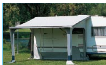
Nehmen Sie die Vorder- und Seitenwände heraus, und Sie haben ein schattiges Plätzchen unter Ihrem Sonnendach!

Wenn Sie auf Tour sind, schließen Sie die Fensterklappen. So haben Hitze und unerwünschte Blicke keine Chance!