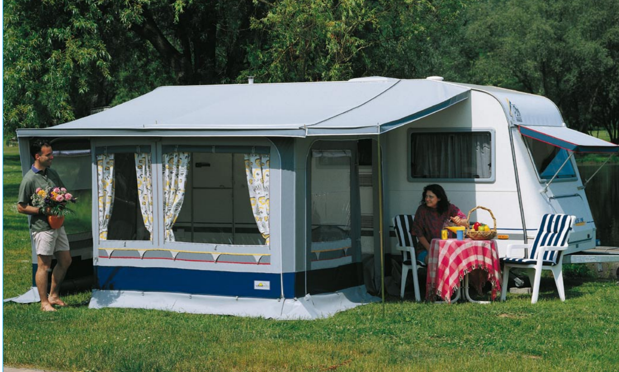
Das abgebildete Verandadach ist ein Extra und separat zu bestellen.

■ Verandadach: ca. 270 cm tief, Anbringung über Doppelkeder-schienen und Gestänge (Extra gegen Aufpreis).