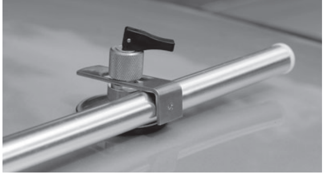
4. Sonderausstattung / special equipment: mit Klappsauger und Klemmstange/ with sucker and connection pole